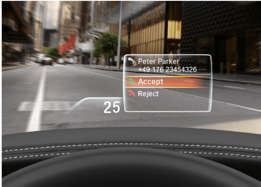
Affichage pour les series 7 BMW

C'est aussi son premier client : 24,5% des ventes en 2022 et 22,7% en 2023. Nippon Seiki a pour clients de nombreux autres constructeurs auto : Chrysler, Mazda, Subaru, Audi, BMW, Mercedes-Benz, ... Et pour les constructeurs moto : Honda, Kawasaki, Suzuki et Yamaha.